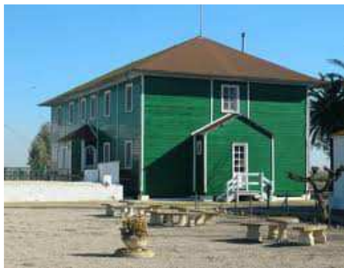
La Casa de Fusta

Preu, inclòs viatges, dinar i visites: Socis 43€ / No socis 45€ (places limitades) Venda i reserva dies: 18, 19 i 20 de juny de 5 a 7 de la tarda en la taquilla de l'Ateneu