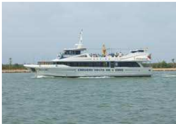
Creuer del delta de l'Ebre

Itinerari: Sortida amb autocar a les vuit del matí, de davant de l'estació del carrilet. Esmorzarem pel camí, en un àrea de servei de l'autopista (a compta de cadascú). En arribar a Deltebre farem un passeig en vaixell pel riu Ebre, fins a la desembocadura. A l'hora de dinar anirem al restaurant NURI (a costat del riu) per fer el següent àpat: