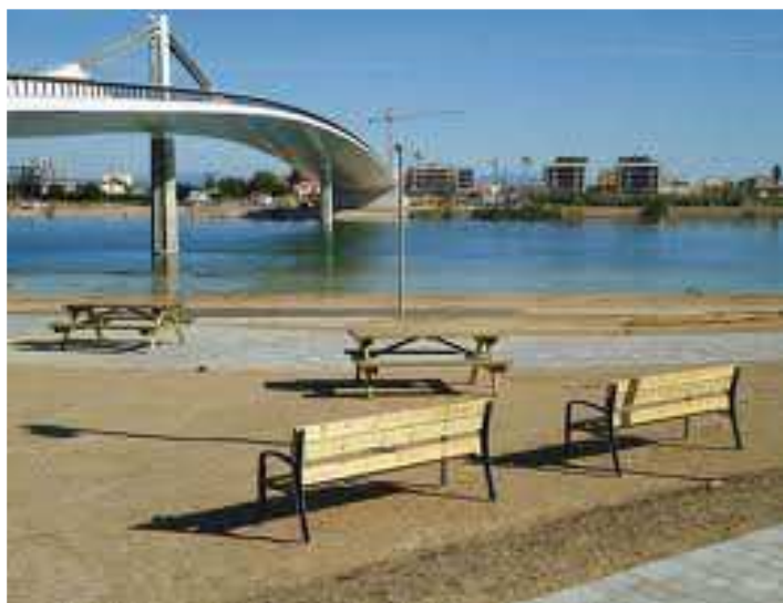
Nou pont de Deltebre a La Cava

Per la tarda anirem fins el marge dret del delta a visitar la Casa de Fusta i, a una hora prudencial, tornarem cap a Sant Boi.