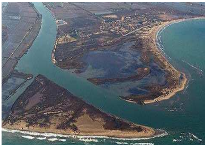
Vista aèria del delta